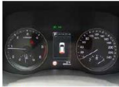
Unmissverständlich präsentieren sich die gut ablesbaren Hauptinstrumente.

Nun, wie fühlt sich der neue, 1775 Kilogramm schwere und 4,47 Meter lange SUV aus dem Hause Hyundai auf der Strasse an? Während der ersten Wegfahrt fällt die zügige Beschleunigung mit maximal 400 Nm Drehmoment des