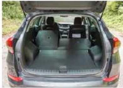
513 Liter fasst der Kofferraum, welcher auf 1503 Liter erweitert werden kann.