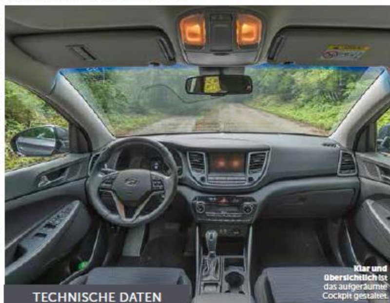
Klar und übersichtlich ist das aufgeräumte Cockpit gestaltet.

D as Segment der Kompakt-SUV ist bei den Helvetiern sehr beliebt. Das ist nachvollziehbar, weil diese Wagenklasse im Flachland wie auch in den Bergen einige Vorteile im Vergleich zu einem «normalen» Auto bietet. Für welche Marke soll man sich entscheiden? Das ist in der Tat beim derzeit grossen Modellangebot die Gretchenfrage. Einer, der das Zeug zum Verkaufsschlager hat, ist der neu aufgelegte Hyundai Tucson, den wir in der Version 2.0 CRDi 4WD Plena getestet haben. Warum? Weil der Nachfolger der Generation ix35 eine