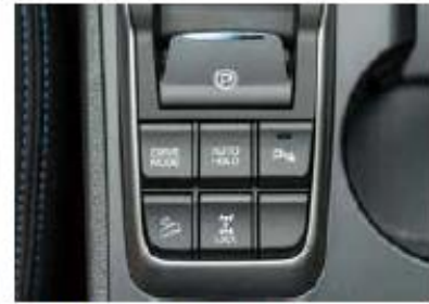
Bergwärts Bei steilen Abfahrten leistet die Bergabfahrhilfe gute Dienste.

Zweiliterdieslers sofort auf. Man kommt gut vom Fleck und ist bei Reisegeschwindigkeit auf dem Highway erstaunt über die Laufruhe des Aggregats, welches 185 PS entwickelt. Bei 120 km/h beträgt der Innenlärm bloss 68 Dezibel. Der Dieselmotor harmoniert bestens mit dem Sechsgang-Automatikgetriebe. Mehr Beschleunigung ist mit dem Einschalten des Sportmodus möglich. Der SUV lässt sich gut mit der etwas leichtgängigen Lenkung manövrieren. Vor allem beim Einparken hilft der enge Wendekreisradius. Geht es einmal über Schotterpisten den Berg hinauf, bewältigt der Tucson diese Herausforderung ohne zu versagen. Das, obschon er als Soft-Offroader eingestuft ist. Hilfreich ist dabei die gut regulierende Bergabfahrhilfe. Und sollte das Terrain