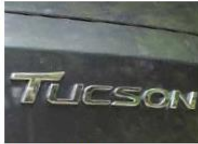
ix35 ist Geschichte der neue SUV von Hyundai heisst wieder Tucson.